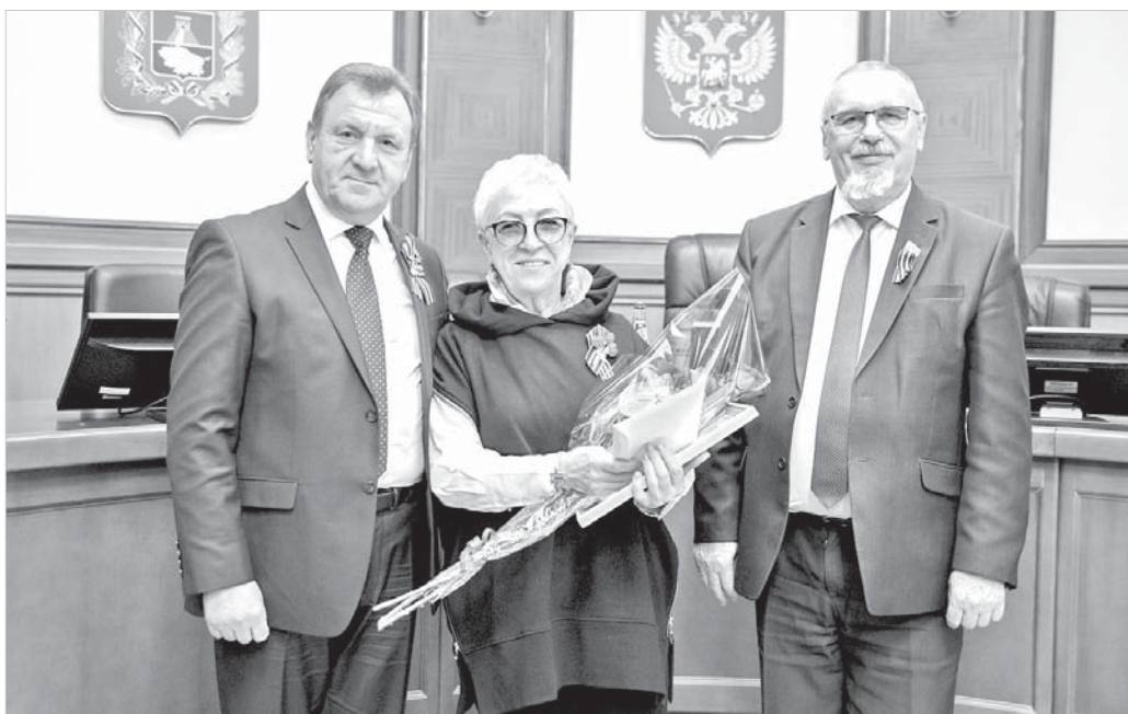
Глава города Ставрополя Иван Ульянченко и председатель Ставропольской городской Думы Георгий Колягин поздравляют победителей.

яние условий и охраны труда в организациях, расположенных на территории города Ставрополя»: