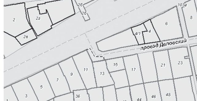
ФРАГМЕНТ № 5 карты градостроительного зонирования