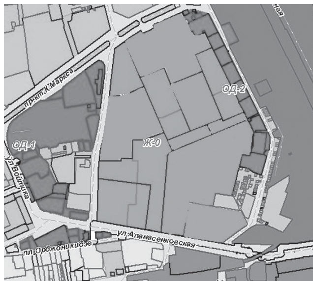
ФРАГМЕНТ № 2 карты градостроительного зонирования