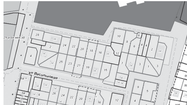
ФРАГМЕНТ № 4 карты градостроительного зонирования