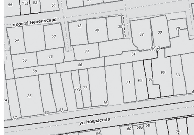
ФРАГМЕНТ № 6 карты градостроительного зонирования